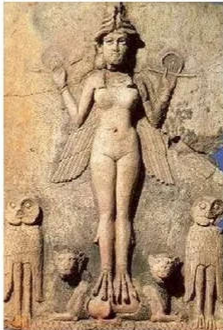
la diosa Astarté o Ishtar babilonica

La nombre de Easter en el idioma anglosajón se pronuncia “ eâster, eâstron ”; en el idioma alto alemán antiguo, se pronuncia como “ ôstra ôstrara, ôstrarun ”; en el idioma alemán moderno se pronuncia como “ Ostern ”.