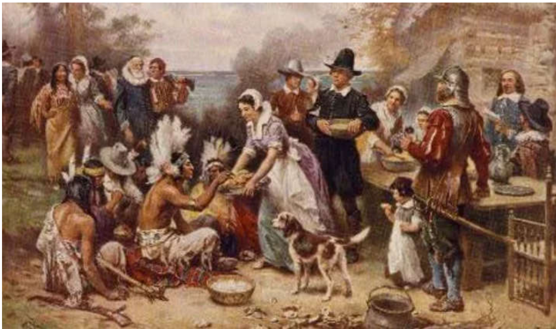
A painting depicting the first Thanksgiving features pilgrims and native Americans joining together for a feast.

Fue tan abundante la cosecha ese otoño, que festejaron con los indígenas por tres (3) días consecutivos. Cazaron aves, mataron venados y cocinaron todo tipo de comida en camaradería. Parecía un “ barbecue ” moderno, con juegos y competencias al aire libre.